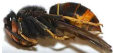
Gyne FA en dormance pendant la phase hivernale