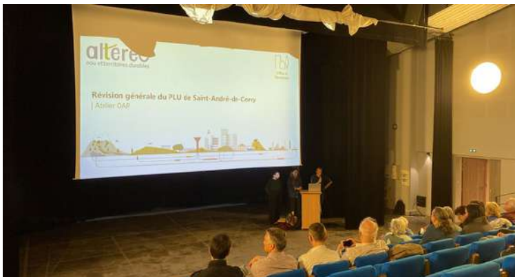
Réunion publique du 7 octobre 2024

En phase 4, prévue fin du 1er trimestre 2025, nous définirons le règlement et le zonage.