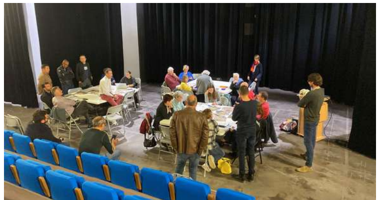
Conclusion des ateliers de travail.