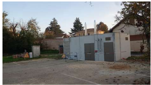
Chaufferie en activité pour la reprise de la Toussaint!

Depuis le 4 novembre 2024, la rue des Écoles est coupée à la circulation sur toute la longueur du parking de l'ancienne cantine pour permettre de continuer les travaux de construction de l'ensemble cantine et périscolaire.