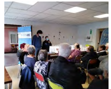
Accueil des participants avec Monsieur le Maire

Épreuve de parcours avec lunettes simulant une consommation d'alcool