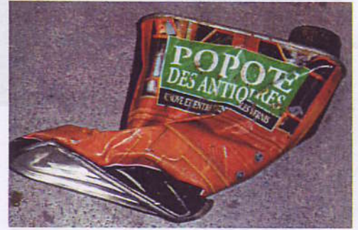
Produits toxiques : Bidon de vernis