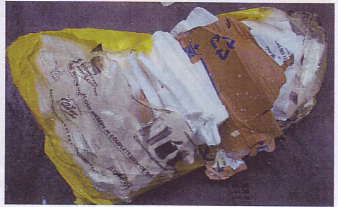
Sac entier de polystyrène

Flacons en plastique contenant du liquide dont la toxicité n'a pas été identifiée