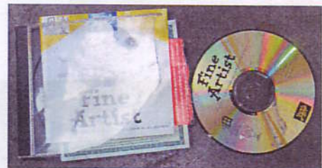
Déchets de bureautique : CD