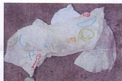
Les papiers gras : Boîtes à pizza, papier de traiteur...