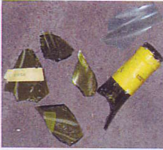
Verre : Bouteille de vin cassée