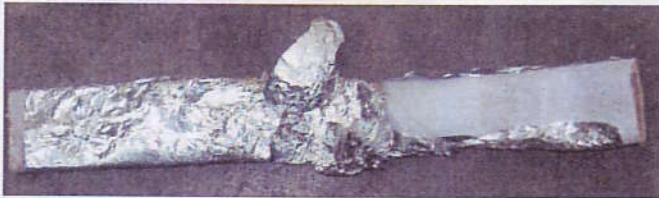
Rouleau de papier aluminium