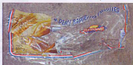
Les films plastiques : Sacs de caisse, Pochette plastique, films de pack d'eau...